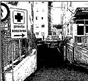
L'ingresso del pronto soccorso dell'ospedale di Tivoli