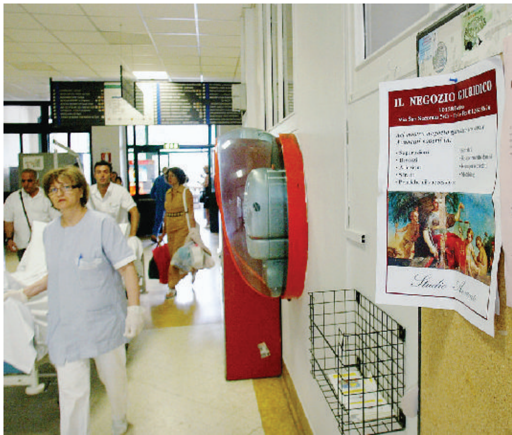
Uno dei volantini del Negozio Giuridico appeso in bacheca lungo i corridoi centrali delle Molinette

Gli avvocati si dissociano dagli spot all'ospedale Molinette